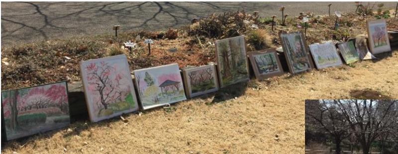
↑作品を並べました。