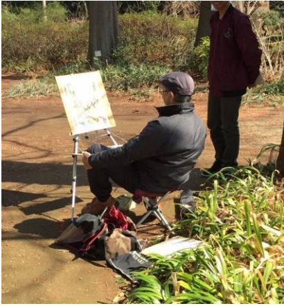
←緑の王国の作業 員と歓談しながら